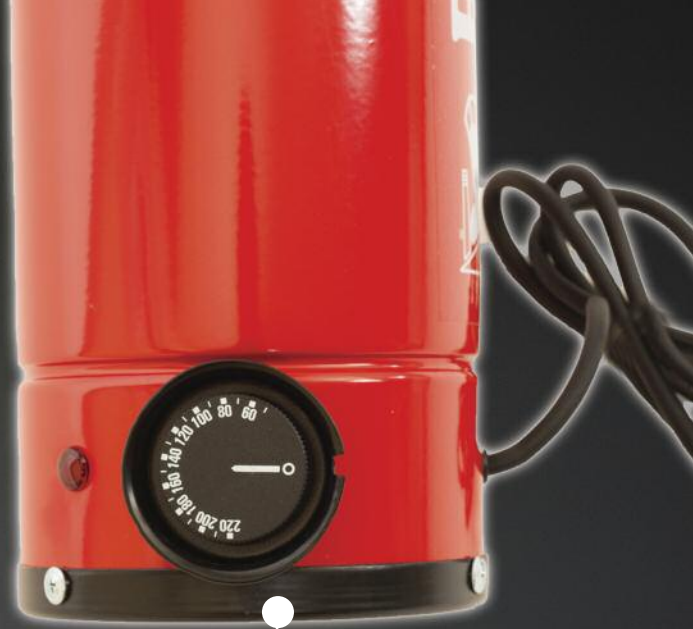
Temperature regulator 60°-220°C