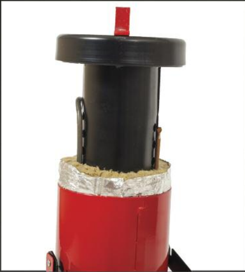
Special insulation of 25MM thickness with aluminum foil