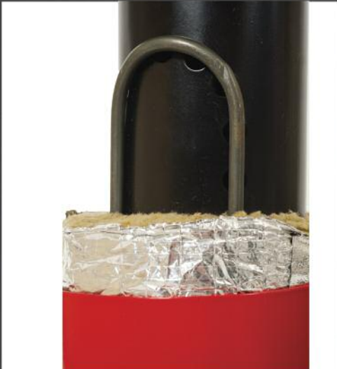
Resistance 300 Watts